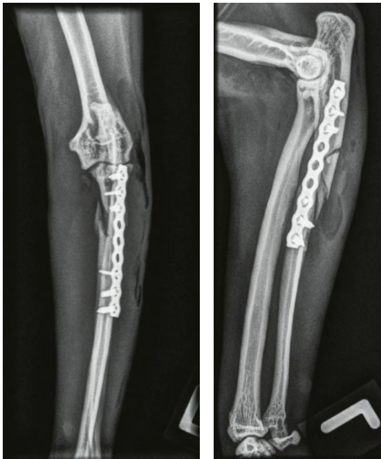
Abbildung 3: Postoperative Aufnahme der 5-Jahre alten Katze. Der Radiuskopf ist reponiert, die Ulna mit einer Platte versorgt.